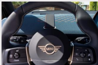
*Volante deportivo de tres radios en cuero sintético