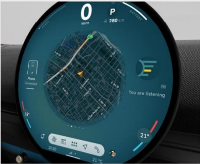
*MINI Interaction Unit