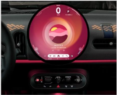
*Modos MINI Experience