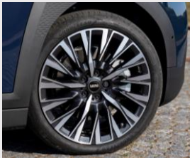
*Llantas Eternal Spoke de 19 pulgadas de 2 tonos (1QW)